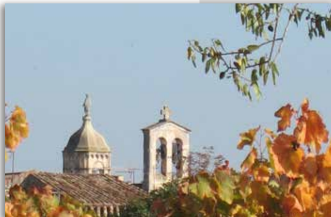
Saint Jean de Serres